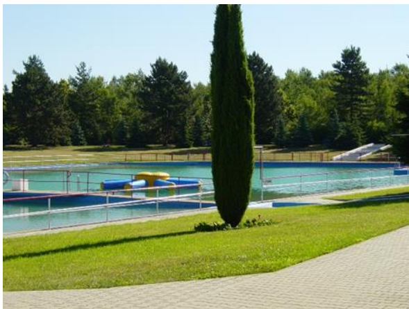
Gelände mit damaliger Nutzung