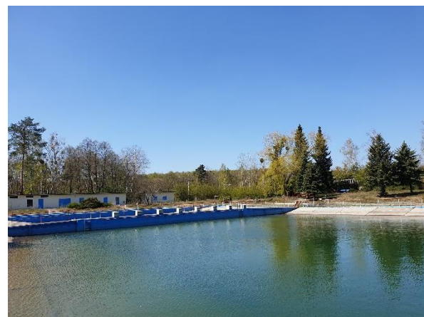
Gelände im derzeitigen Zustand